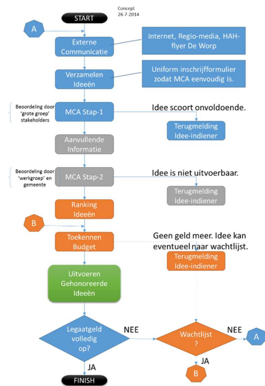
Figuur 2 - Processchema Fase-2