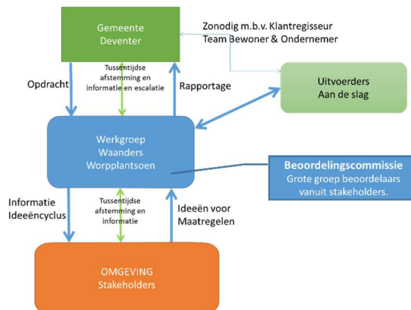
Figuur 3 - Positionering Werkgroep

De activiteiten en taken binnen de werkgroep worden toegewezen aan werkgroep leden en/of externe medewerkers (expertisegebied).